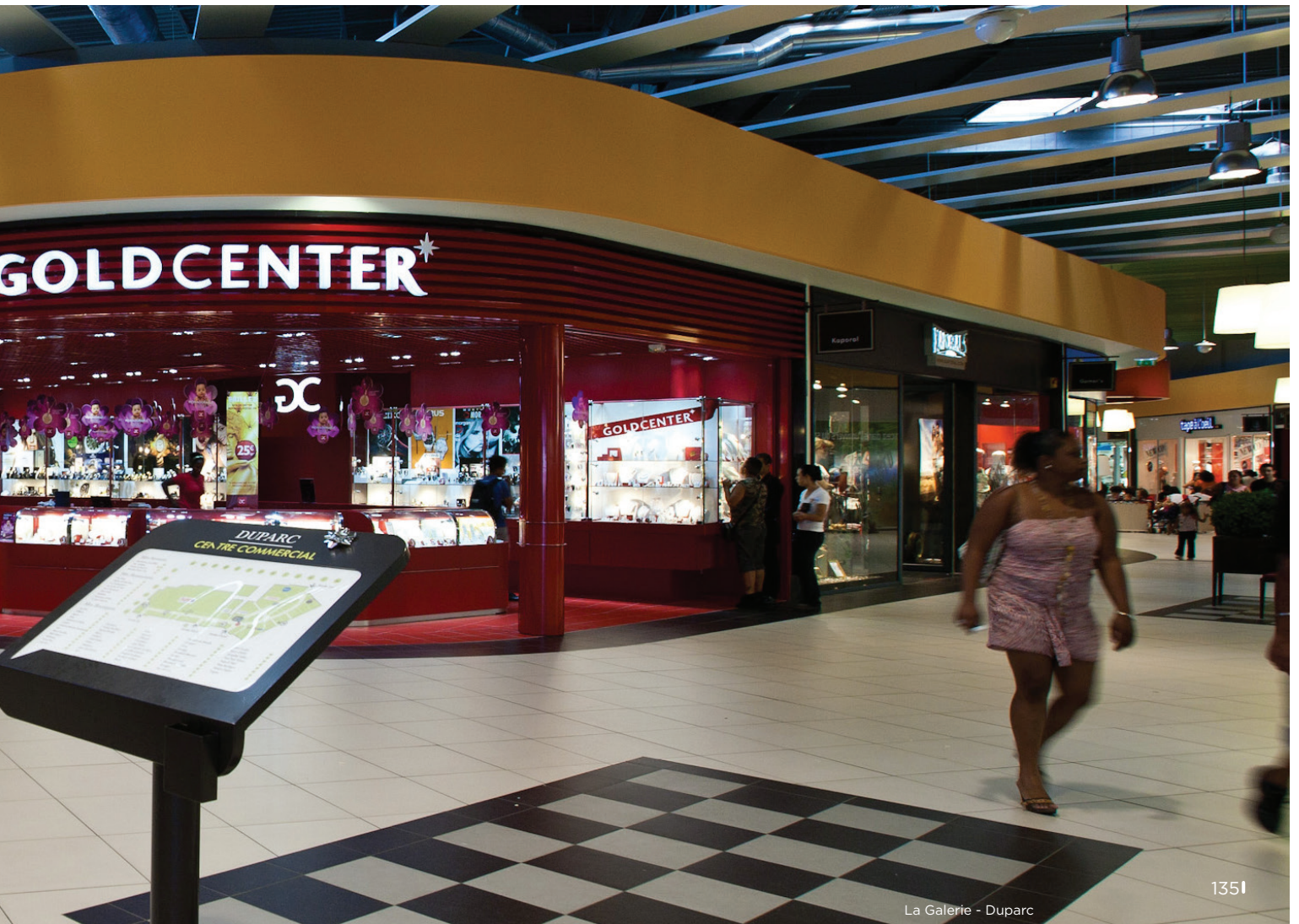
La Galerie - Duparc