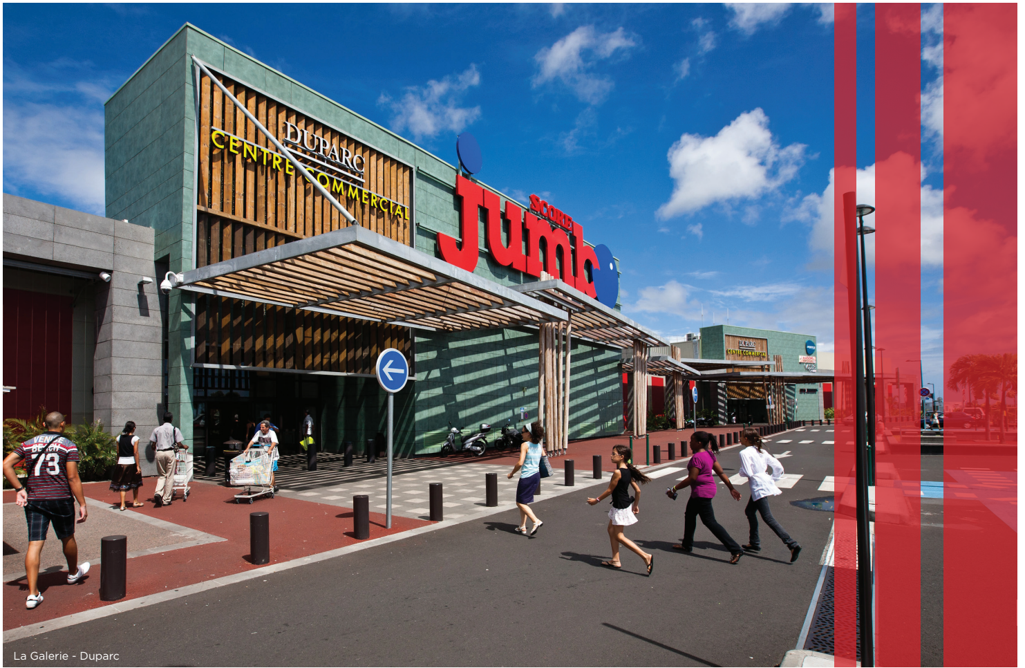
La Galerie - Duparc