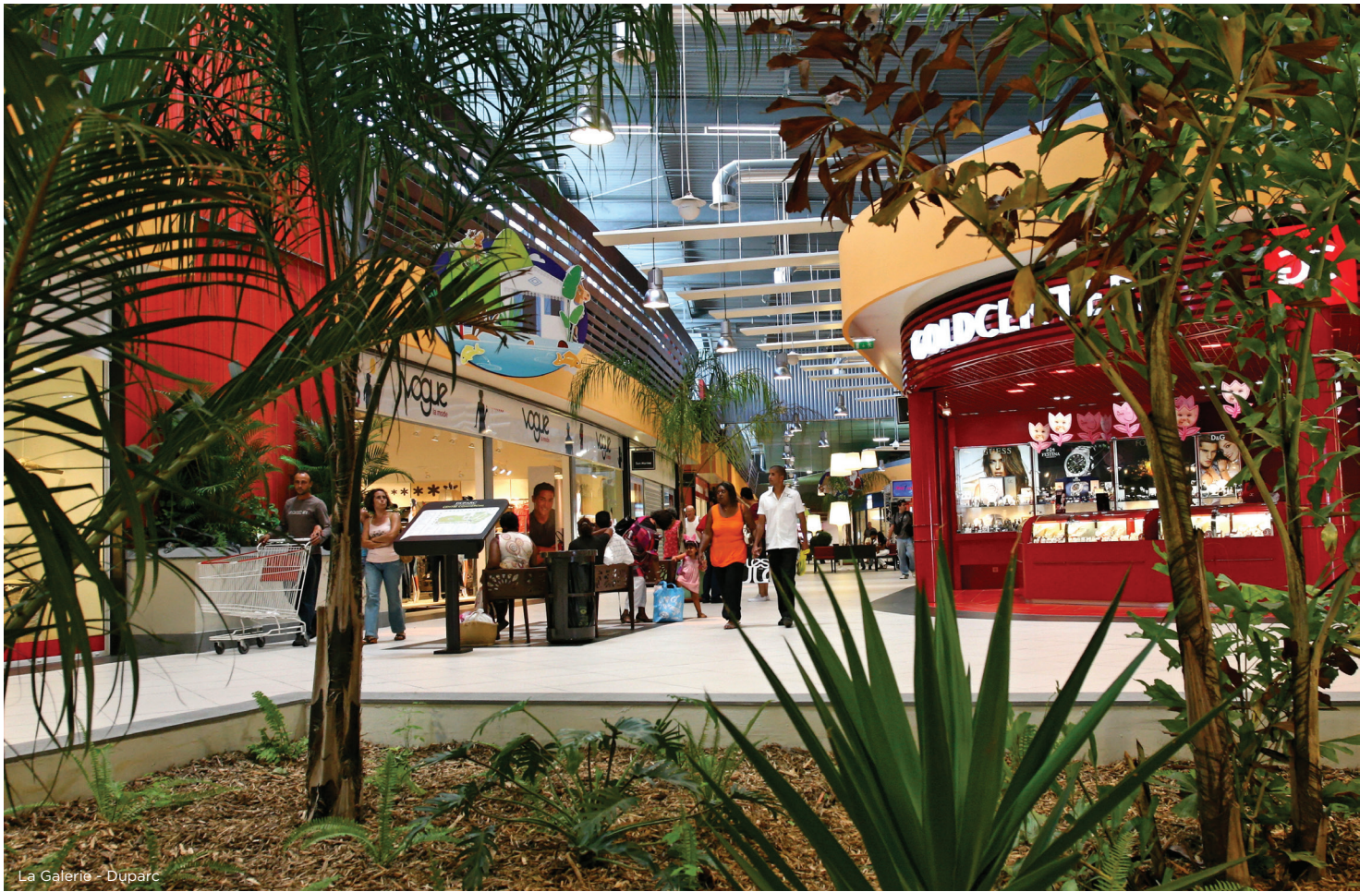
La Galerie - Duparc